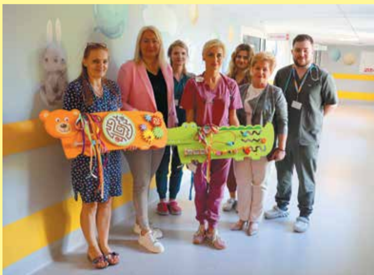
Te kolorowe zabawki umilą czas najmniejszym pacjentom

łaczekwie. Została tam bardzo ciepło przyjęta przez dzieci, którym poza słodyczami wręczyła także bidony na wodę. Najmłodsi nie kryli radości