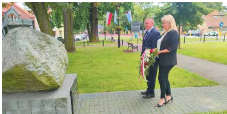
...i w Miłosławiu