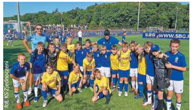
W drużynie siła