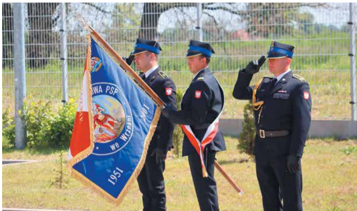
Strażacki poczet sztandarowy podczas uroczystości