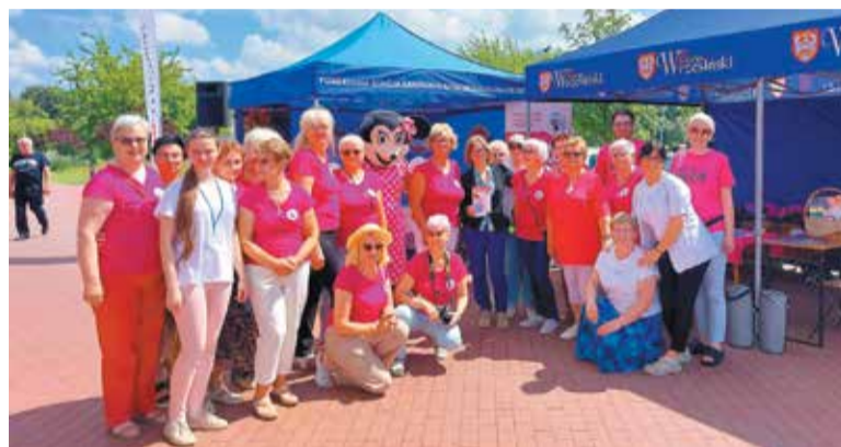
To już druga edycja tego wydarzenia