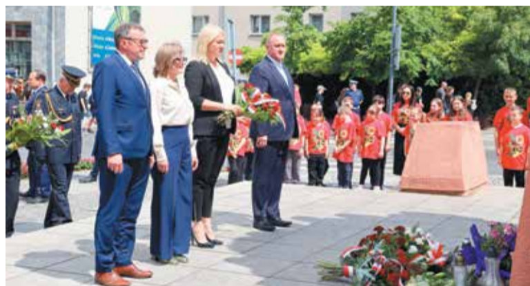
Powiatowa delegacja we Wrześni...

Mieszkańcy powiatu wrzeńskiego jak co roku pamiętali o uczniach, którzy w czasie zaborów przeciwstawili się nauce religii w języku niemieckim.