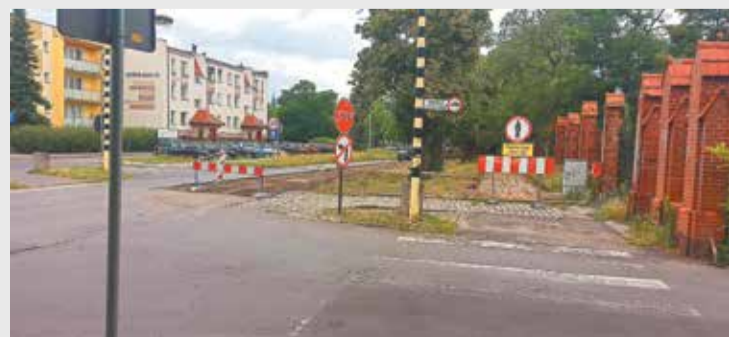
Na Kościuszki roboty ruszyły pełną parą