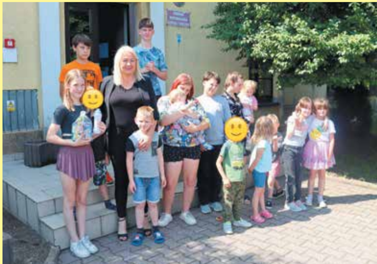
Przed budynkiem OWDiR-u

Starosta nie zapomniała również o podopiecznych Ośrodka Wspomagania Dziecka i Rodziny w Ko-