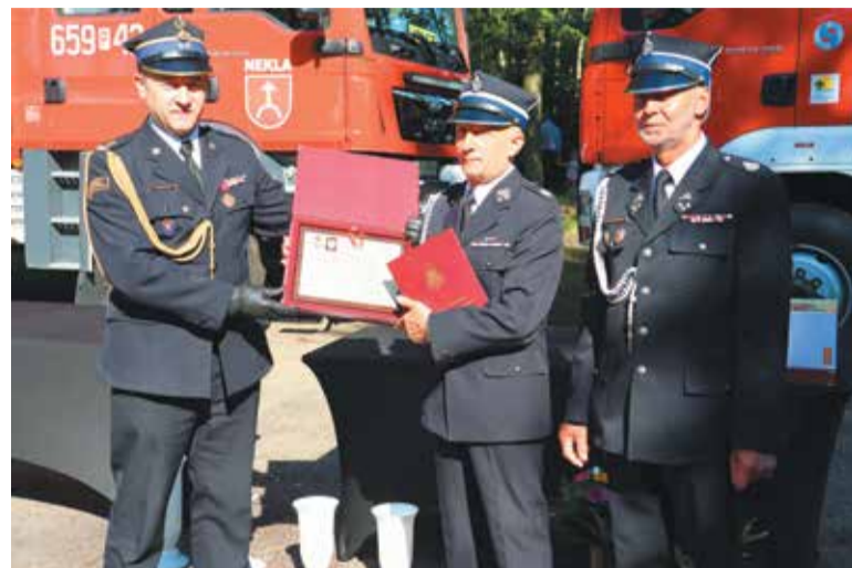
Jednostka w Nekli funkcjonuje już prawie od wieku

Nekielska Ochotnicza Straż Pożarna obchodziła 95. rocznicę powstania 25 maja.