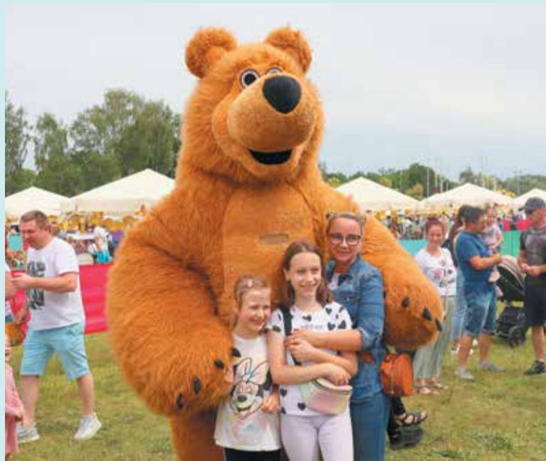
Ogromne maskotki cieszyły się dużą popularnością