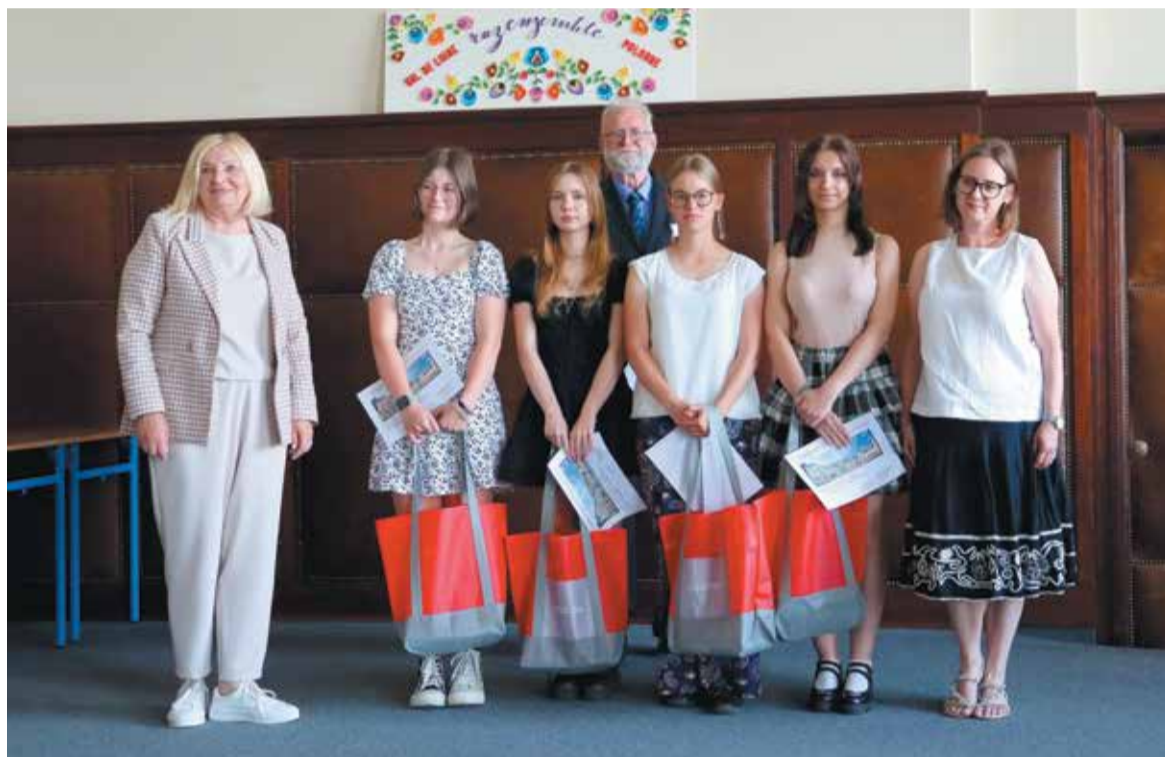
Konkurs języka francuskiego to już tradycja międzynarodowych kontaktów