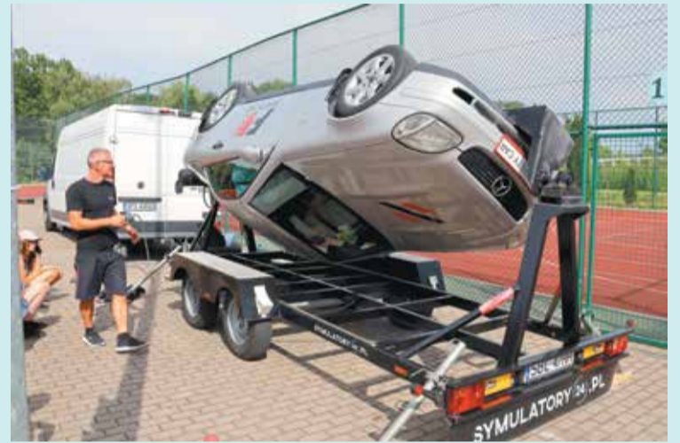
Podczas pikniku można było dowiedzieć się dużo o bezpieczeństwie