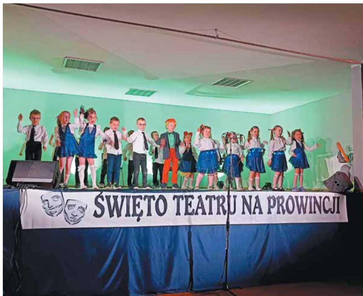
Oni dobrze czują się na scenie od najmłodszych lat