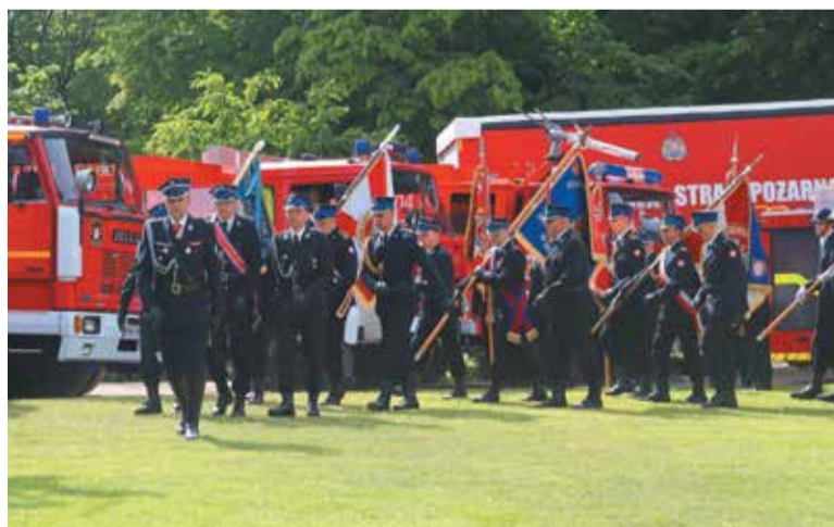
Do Miłosławia przyjechało mnóstwo delegacji

Część oficjalna wydarzenia odbyła się w miłosławskim parku. Tam odegrano hymn państwowy i podniesiono biało-czerwoną flagę. Ważnym punktem obchodów było wręczenie odznaczeń wyróżniającym się dru-