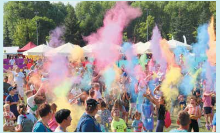
Niedziela z powiatem ma wiele barw