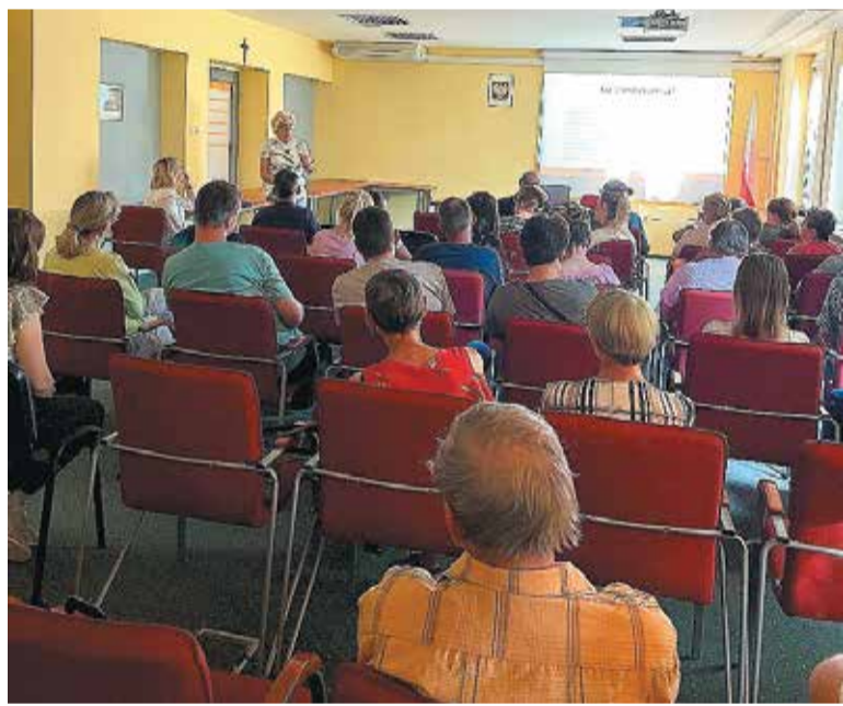
Udzielone rady na pewno pomogą w opiece nad najmłodszymi

29 maja w Powiatowym Urzędzie Pracy we Wrześni odbyło się szkolenie pn. „Depresja u dzieci i młodzieży. Jak pomóc dzieciom. Wskazówki dla rodziców zastępczych”.