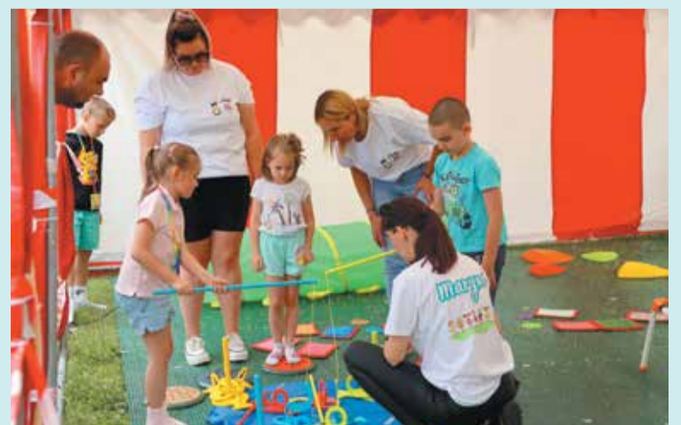
Dobra zabawa w Sensochacie