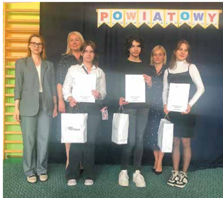
Chemia to ich ulubiona dziedzina nauki