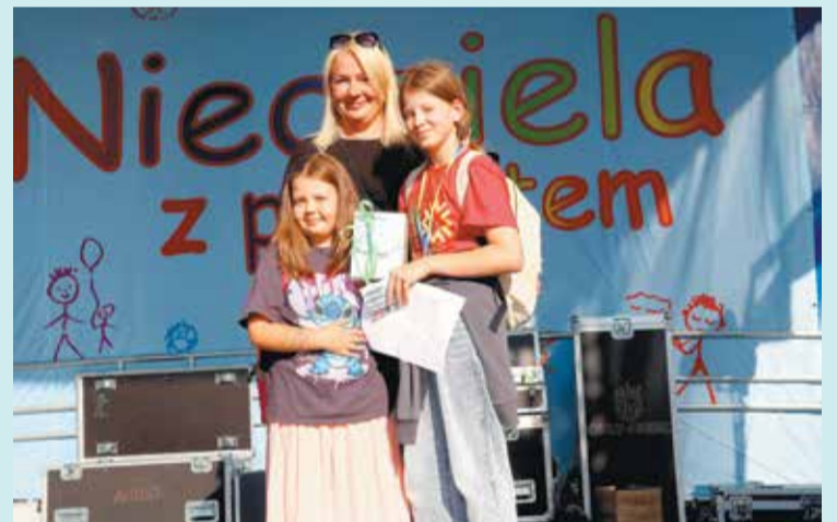
Zdobywczynie nagrody głównej w loterii wraz ze starostą