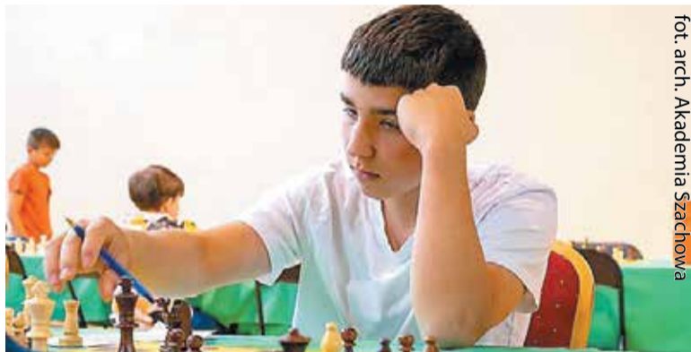
fot. arch. Akademia Szachowa