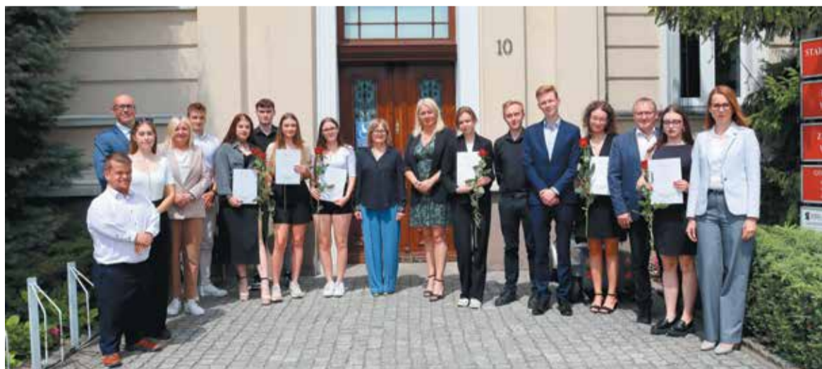
Ci uczniowie mogą być dumni ze swoich osiągnięć

Uroczyste wręczenie Stypendiów TALENT 2024 odbyło się 19 czerwca w Starostwie Powiatowym we Wrześni.