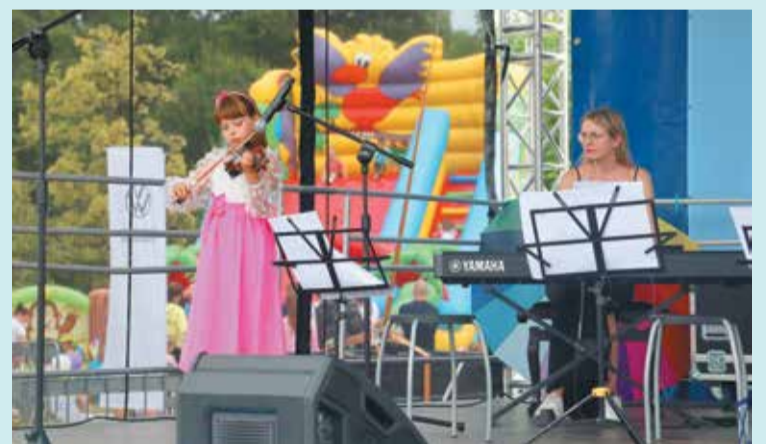
Na scenie występowali m.in. uczniowie powiatowych szkół