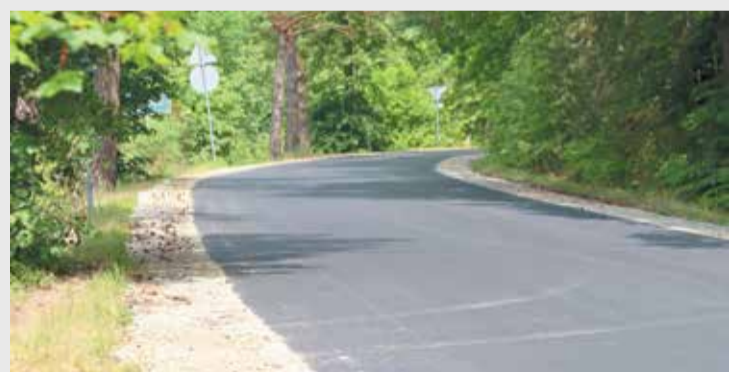
Nowa nawierzchnia drogi Sarnice – Mikuszewo

ruchu polegająca na wyłączeniu z użytkowania jednego pasa jezdni przy jednoczesnym wprowadzeniu ruchu jednokierunkowego – od sklepu LIDL w kierunku kościoła pw. Świętego Ducha. Wszystkich użytkowników drogi prosimy o wyrozumiałość, szczególną ostrożność i zwracanie uwagi na oznaczenia. Koszt tej inwestycji wyniesie 8 135 861,26 zł, z czego 4 409 375,86 zł pozyskano z Rządowego Funduszu Rozwoju Dróg. (red.)