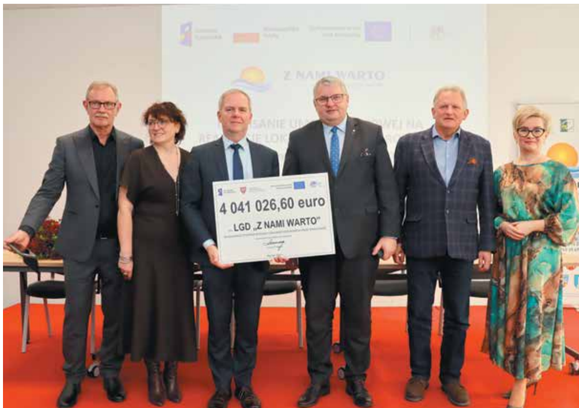
Członkowie stowarzyszenia mogą być zadowoleni z pozyskania tak dużych środków