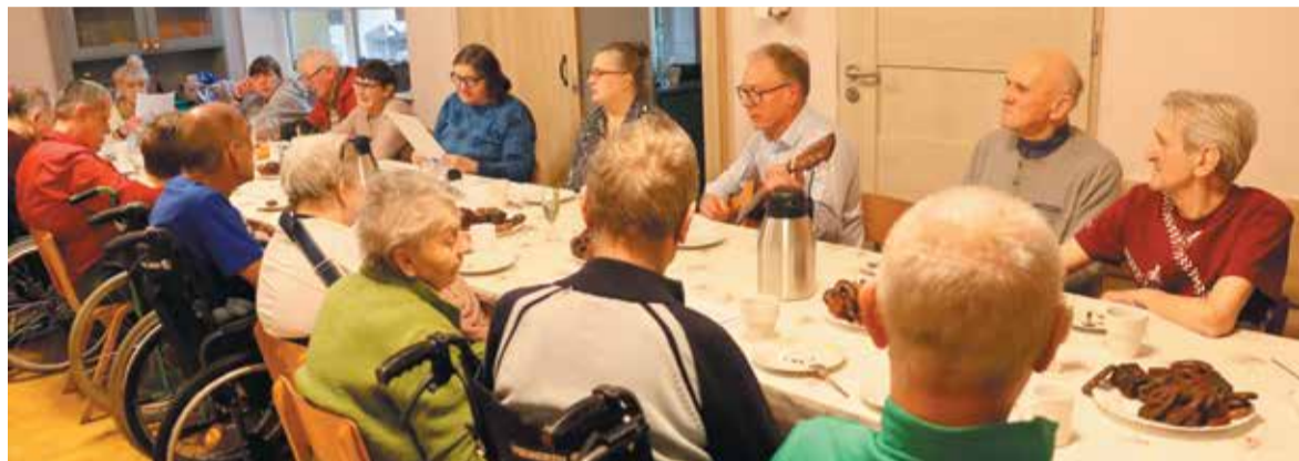
Takie spotkania to okazja do integracji