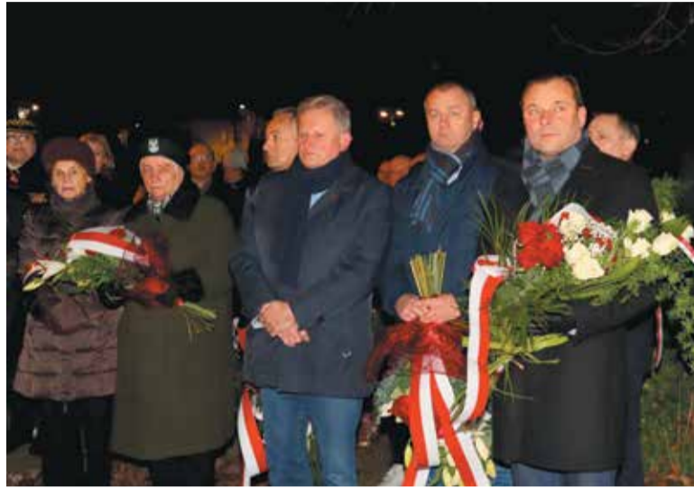
Bialo-czerwone wiązanki to nieodłączny element patriotycznych obchodów