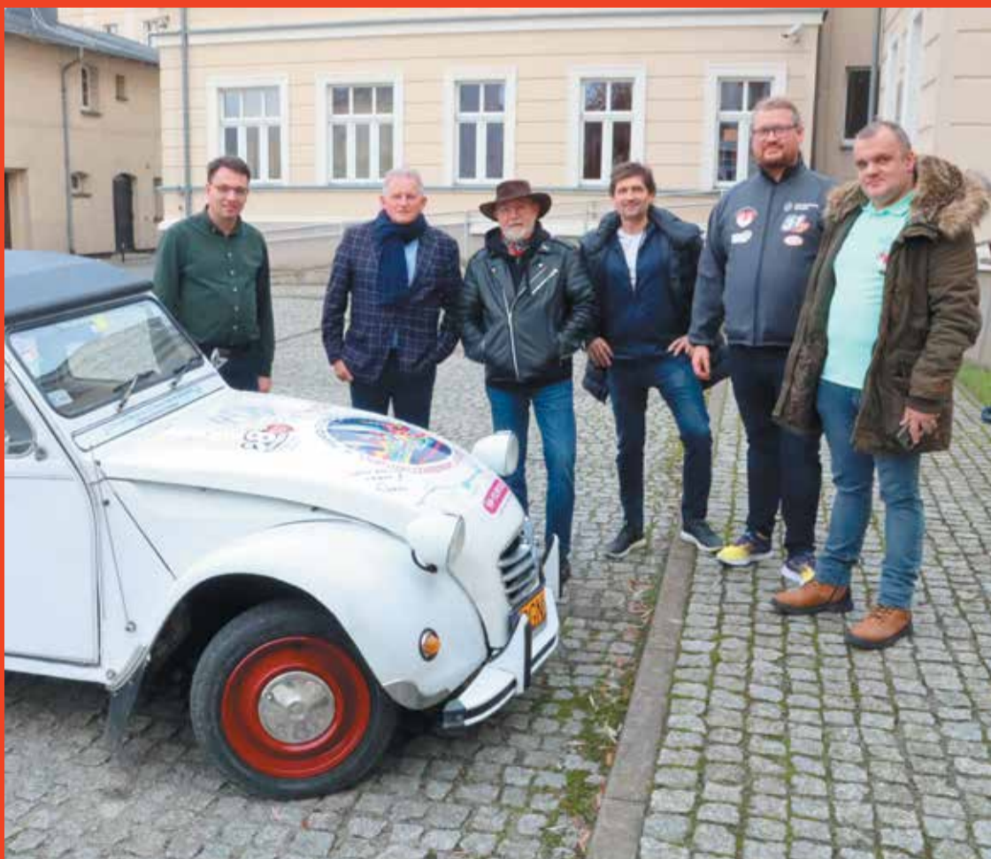
Organizatorzy biegu podczas wizyty w Starostwie Powiatowym we Wrześni