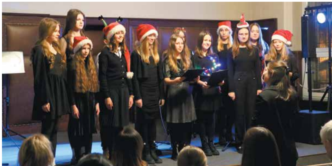
PSM to nie tylko gra na instrumentach, ale także śpiew

Kilka dni przed wigilią uczniowie Powiatowej Szkoły Muzycznej I stopnia we Wrześni zagrali koncert pn. „Przed pierwszą gwiazdą”, dzięki któremu poczuć można było zbliżające się Boże Narodzenie.