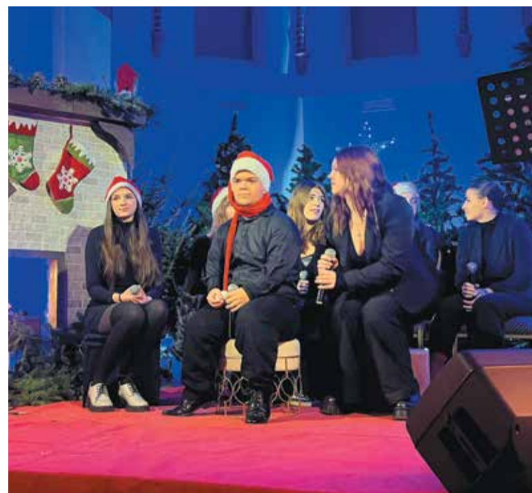
Na ZAMKOWEJ zrobiło się nostalgicznie