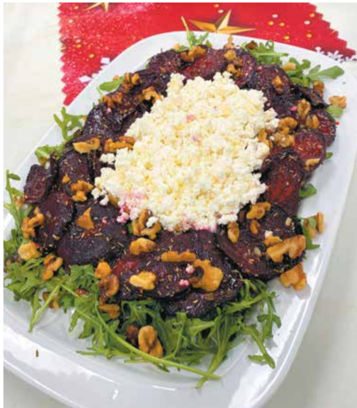
Sałatka wykonana przez Amelię Jabłońską i Julię Michalak z klasy 3TŻIUG pod opieką Adrianny Szparagowskiej

• Piekarnik nagrzać do 220°C. Nagrzewać w nim żaroodporną blaszkę lub formę. Buraka obrać i pokroić na cienkie plasterki. Doprawić go solą, pieprzem i rozmarynem. Obtoczyć w około 4 łyżkach oliwy extra vergine i położyć na rozgrzanej blaszce w piekarniku. Piec około 5 minut, przewrócić na drugą stronę i piec jeszcze przez następne 5 minut (lub krócej, w zależności od grubości plasterków). W połowie pieczenia dodać do buraczków połamane orzechy włoskie i lekko je zrumienić.