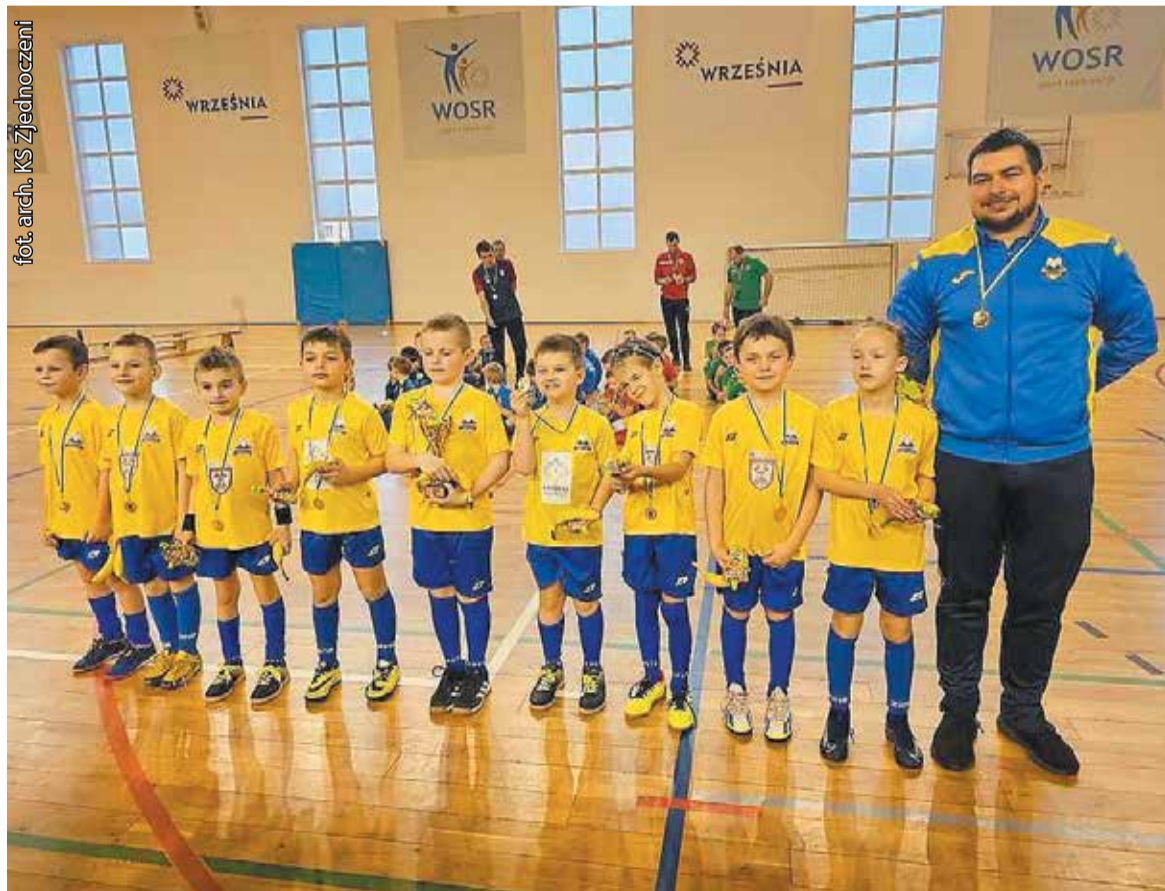
Pamiątkowe zdjęcie z turnieju