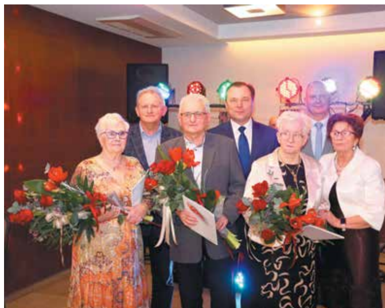
Nie mogło zabraknąć kwiatów dla jubilatów