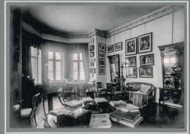
Nekla - salonik.