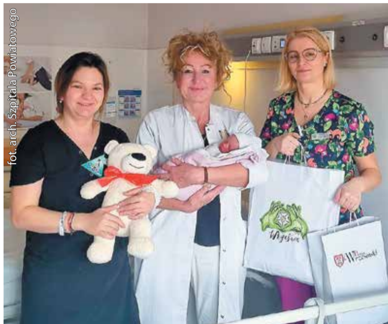
Julce i jej mamie życzymy dużo zdrowia i radości