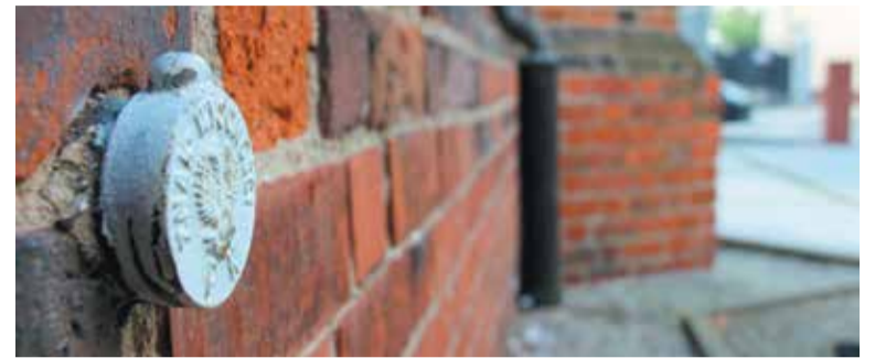
Reper na wrzesińskiej farze

Powiatowy Ośrodek Dokumentacji Geodezyjnej i Kartograficznej zakończył właśnie proces modernizacji szczegółowej osnowy wysokościowej na terenie naszego powiatu.